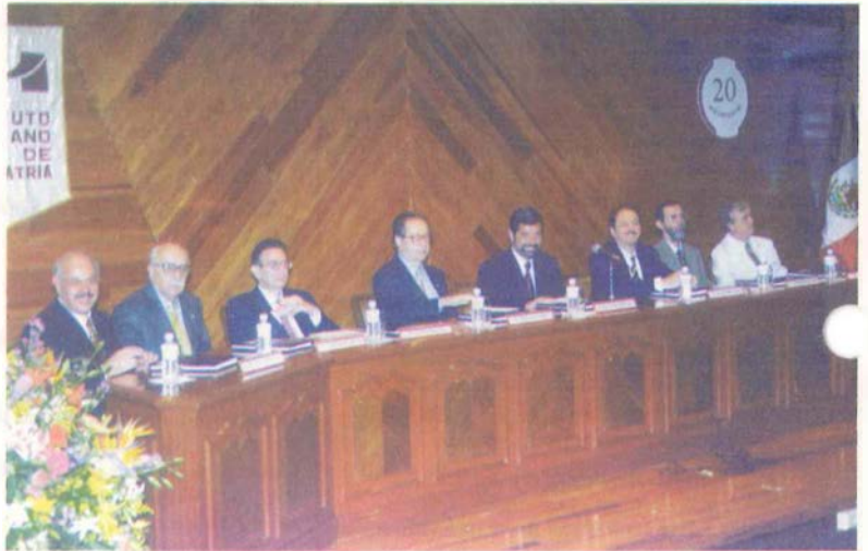
Acto inaugural en el auditorio del Instituto Mexicano de Psiquiatría

En la ceremonia inaugural, el doctor Ramón de la Fuente, director general del IMP, señaló que el Instituto "fue creado en diciembre de 1979 como una institución de servicio público, a la cual se asignaron las siguientes funciones: la investigación científica en la psiquiatría, la formación de investigadores en el campo, el adiestramiento de personal encargado de la salud mental y la asesoría a instituciones públicas y privadas. En septiembre de 1998, un nuevo decreto definió su papel como instituto nacional de salud.