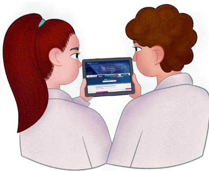
Ilustración: Jimena García

BMJ Best Practice es una plataforma de gran utilidad en el soporte de la toma de decisiones médicas, debido al acceso de evidencias. Gira en torno a la consulta del paciente y con enfoques paso a paso que abordan la prevención, el diagnóstico, el tratamiento y el pronóstico en todo su contenido, ayudando así a educadores, estudiantes e investigadores con sus asesorías completas junto con videos, evaluaciones, opciones de tratamiento, entre otras. Cuenta con constantes actualizaciones y contiene un apartado de apoyo para el paciente. ¡Consúltala desde la Biblioteca Médica Digital!