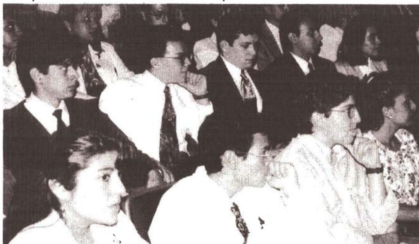
Estos son algunos de los estudiantes que se hicieron acreedores al reconocimiento por parte de la FM

Se tiene así, una transición epidemiológica no sólo bien segmentada en los grupos de edad; sino