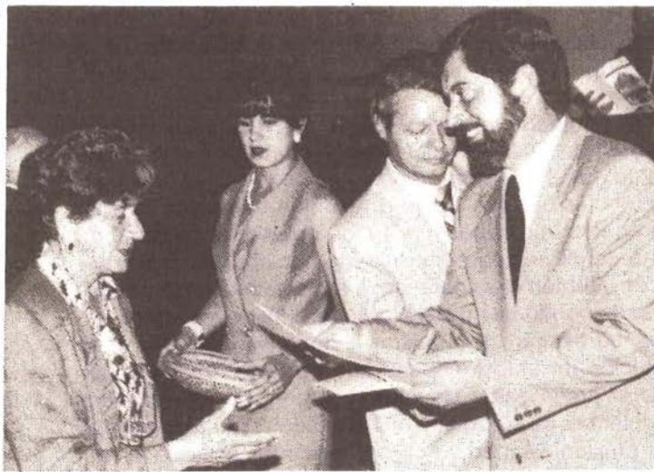
Los miembros de la Generación 1938-1944, festejaron su 1 Aniversario en el Palacio de la Antigua Escuela de Medicina, en donde el Director de la Facultad les entregó reconocimientos. → 7