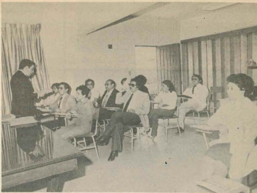
Asistentes al curso.

Al término del curso, el médico general/familiar será capaz de establecer el diagnóstico integral de la patología revisada en el curso, apoyándose, para ello, en los conocimientos y habilidades adquiridos; utilizar los recursos de salud (humanos y materiales) que estén a su alcance, con el fin de optimizar la atención médica prestada; ejercer su juicio clínico para decidir el momento y nivel de atención al cual se referirá, a los pacientes que así lo ameriten, finalmente, integrar los niveles de prevención y atención dentro del esquema de la historia natural de los padecimientos a los que más frecuentemente se enfrenta.