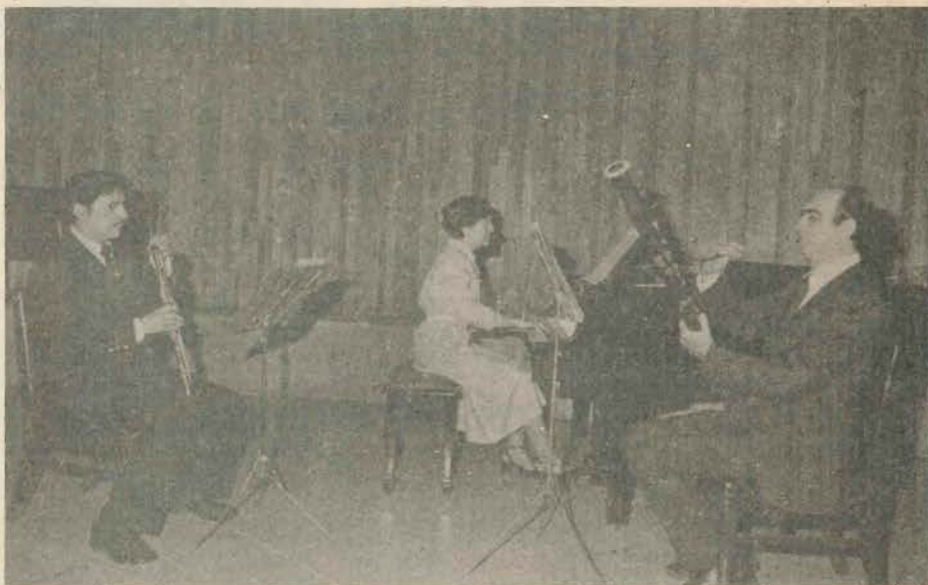
Recital de Música de Cámara con el trío Silvestre Revueltas. Hospital de Gineco-Obstetricia N° 4, 20 de junio.

Este recital se presentó en el Hospital de Gineco-Obstetricia N° 4, IMSS., el pasado 27 de junio, en un evento organizado por la Facultad de Medicina de la UNAM.