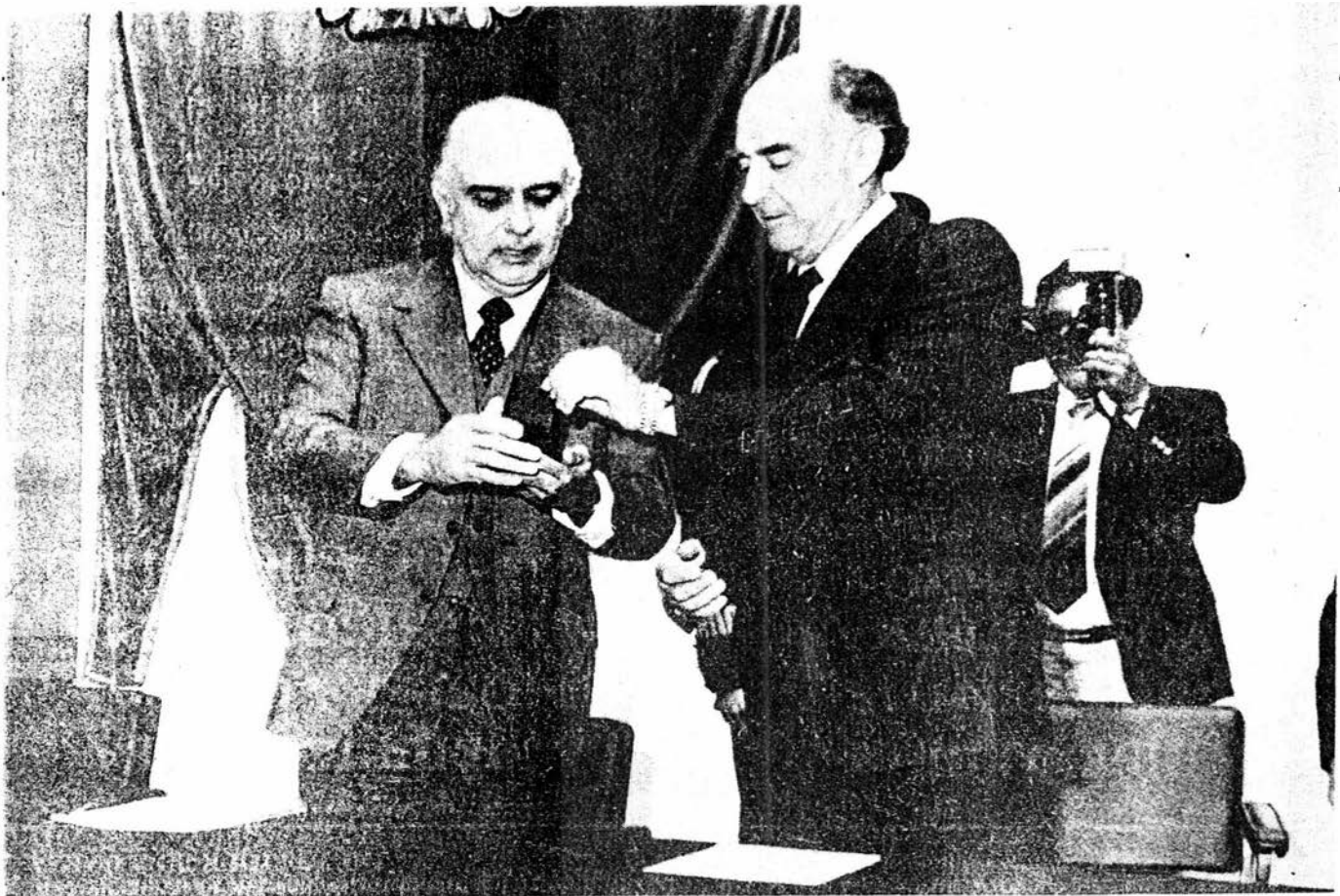
El licenciado José López Portillo recibe de manos del Rector de la UNAM la Medalla Conmemorativa del Bicentenario del Natalicio de Don Valentín Gómez Farías.