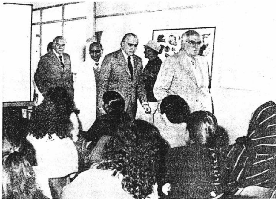
Aspectos del recorrido por los centros de salud.