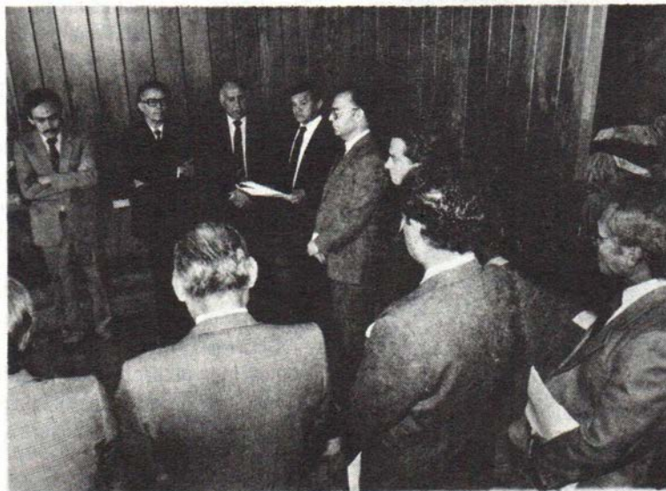
Aspecto de la toma de protesta a la nueva mesa directiva de la Asociación Nacional de Egresados de la Facultad de Medicina.

El doctor Jorge Carpizo, rector de la UNAM, tomó la protesta a la nueva mesa directiva de la Asociación Nacional de Egresados de la Facultad de Medicina.