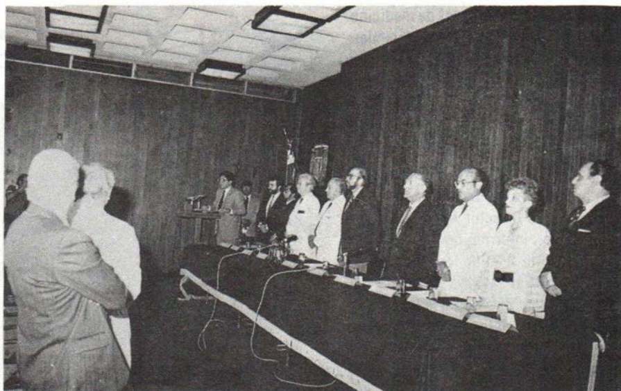
Aspecto de la ceremonia inaugural del I Curso Internacional de Medicina Social y Comunitaria en Centros Urbanos y Rurales

Consideró que aún cuando el dominio de las ideas científicas o la cultura, está relacionado con la creatividad del hombre, se requiere compromiso para ponerlo al ser- ▶ 2