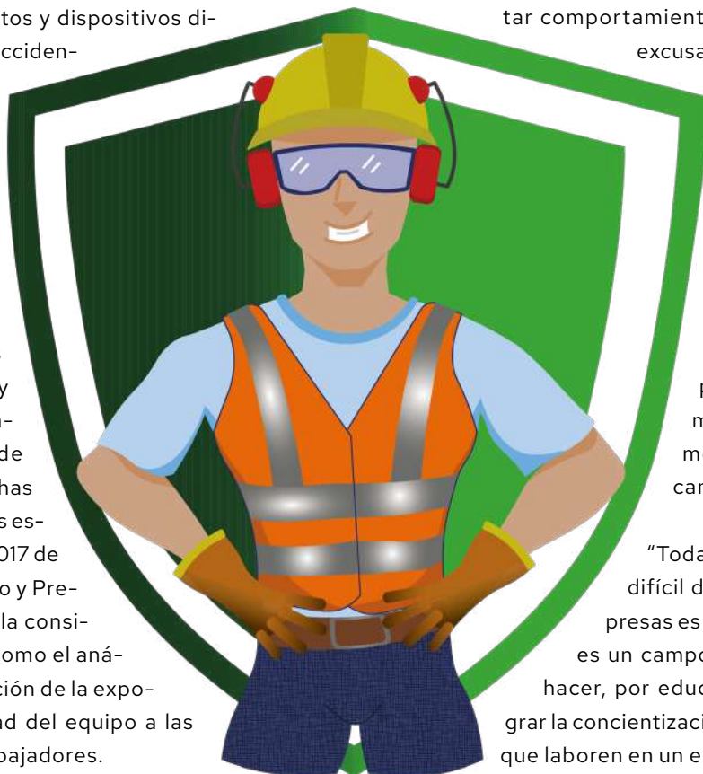
Ilustración: Karina Nava

"Todavía hay una brecha muy difícil de atender, si en las empresas es difícil, el sector informal es un campo donde hay mucho por hacer, por educar y capacitar para lograr la concientización y sensibilización para que laboren en un entorno seguro", finalizó.