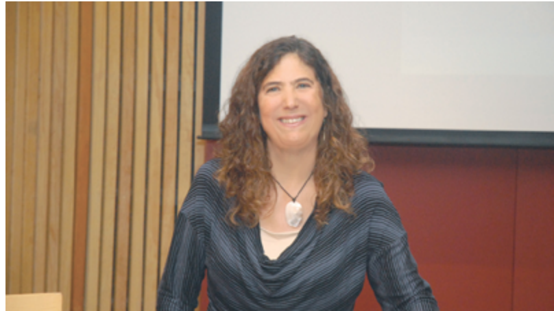
Las comunidades mayas reclaman su lugar en la historia, afirmó la ponente

En Mesoamérica, indicó, la vida se concibe como una serie interminable de ciclos, desde muy pequeños (de un día y una noche) hasta muy lejanos en el devenir, porque hay cargadores que llevan el tiempo en sus espaldas y deambulan por el espacio, dejando caer sus influencias sobre los hombres. “Así, se tienen registros de esos ciclos temporales y, a partir de ahí, hay sistemas muy complejos, como el calendario solar (18 meses de