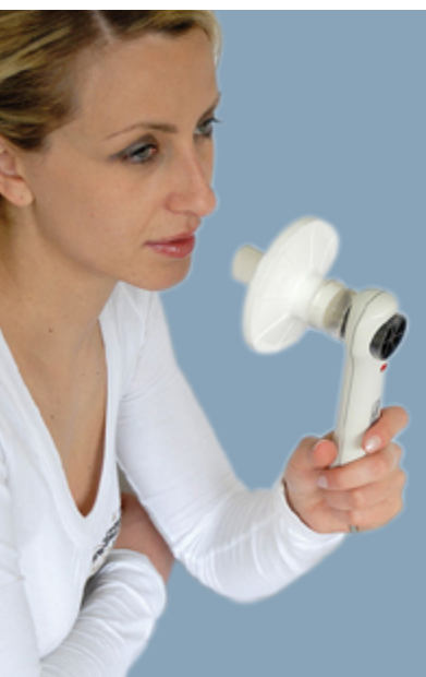
Diseñada por Cosmed

Expuso que "el resultado puede ser cero positivo o negativo. Si está en el rango de -1, -2, -3, -4 y -5 es normal. Si es -6, habla de un daño de las vías aéreas; es decir, de una obstrucción. A mayor negatividad, mayor es el daño y la progresión del padecimiento, así como el pronóstico y la calidad de vida del paciente. De la misma manera será para los parámetros normales +1, +2, +3, +4 y +5, donde +6 significa que se trata de un daño parenquimatoso e intersticial, una enfermedad de tipo restrictivo, con pronóstico más grave que el de las patologías obstructivas, que conducirá a la muerte en un lapso de tres a cinco años". (fm)