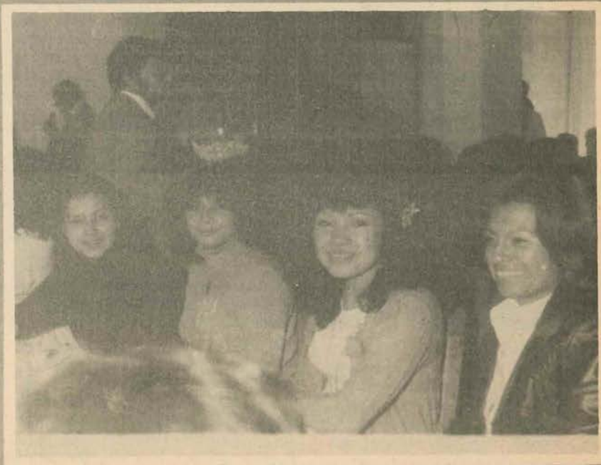
Trabajadores asistentes al convivio.

A continuación el titular de esta dependencia universitaria, hizo un reconocimiento a los trabajadores que cumplieron 25 y 30 años de servicios administrativos, así como a empleados que se distinguieron durante el año por su eficiencia y cumplimiento en sus labores encomendadas.