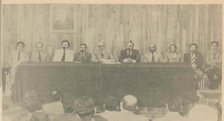
En la parte central de la gráfica aparece el director de la Facultad de Medicina, acompañado de sus colaboradores, durante la Reunión de Evaluación.

En la reunión de trabajo de la Facultad Nacional de Medicina que se efectuó en la ciudad de Querétaro los días 24, 25 y 26 de agosto de 1978, se plantearon acciones a realizar en los siguientes 18 meses a esa fecha, plasmados en planes y programas específicos que en número de 37 se dieron a conocer y fueron aprobados por el Consejo Técnico de la Facultad, el 14 de septiembre del mismo año.