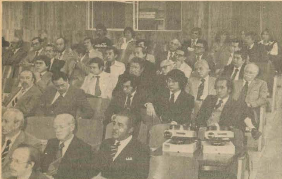
Asistentes a la Reunión de Evaluación de la Facultad de Medicina.

va para lograr un apoyo eficaz a la docencia y a la investigación.