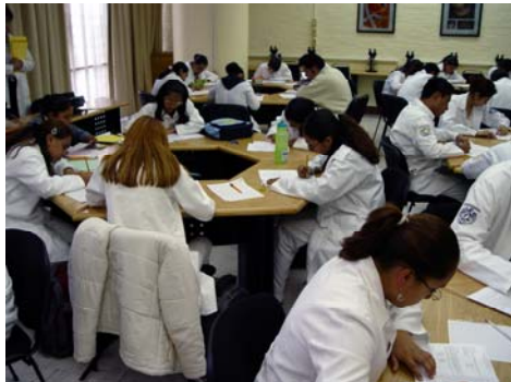
Clases en Biología Celular

De los 997 alumnos de nuevo ingreso a la Facultad, 395 (39.7%) solicitaron ingreso al programa y de entre ellos, 155 fueron aceptados. El total de alumnos inscritos al programa en los distintos años de la carrera ascendió a 707. La Dirección General de Evaluación Educativa concluyó la evaluación externa del programa y el reporte final fue presentado al H. Consejo Técnico el 9 de marzo.