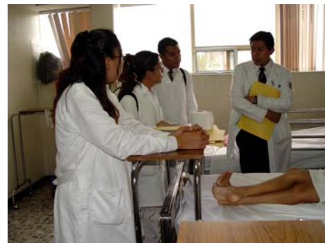
Visita de Internos en el Hospital General

medicina general. Sus objetivos son: consolidar en el alumno la capacidad de integración para el diagnóstico y solución de los problemas de salud que competen al médico general, fomentar la autocrítica y reflexión de su práctica clínica cotidiana; fortalecer los principios, actitudes y conductas ético-humanistas indispensables para el ejercicio profesional; y consolidar su interés por mantenerse actualizado a través del estudio y educación permanente.